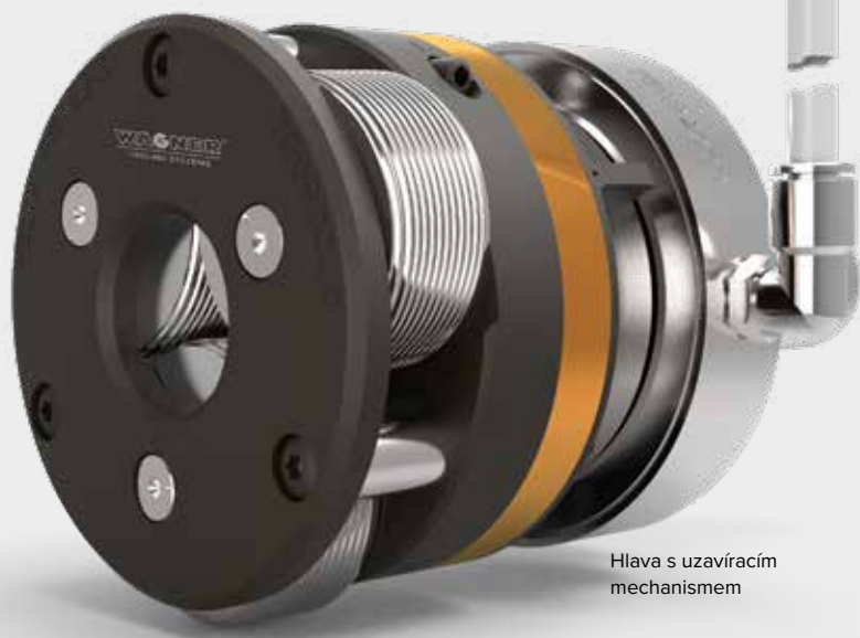
Hlava s uzavíracím mechanismem